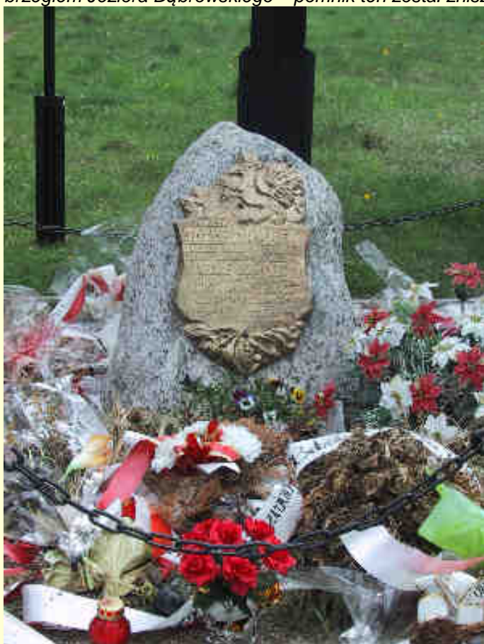
Fot. 5 Tablica pamiątkowa, która znajdowała się na zniszczonym pomniku ku czci por. Józefa Dambka.