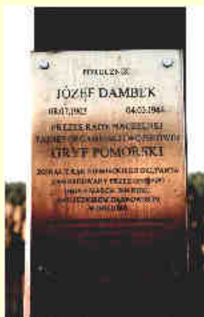
Fot. 7 Tablica pamiątkowa ku czci por. Józefa Dambka, znajdująca się na nowym krzyżu.