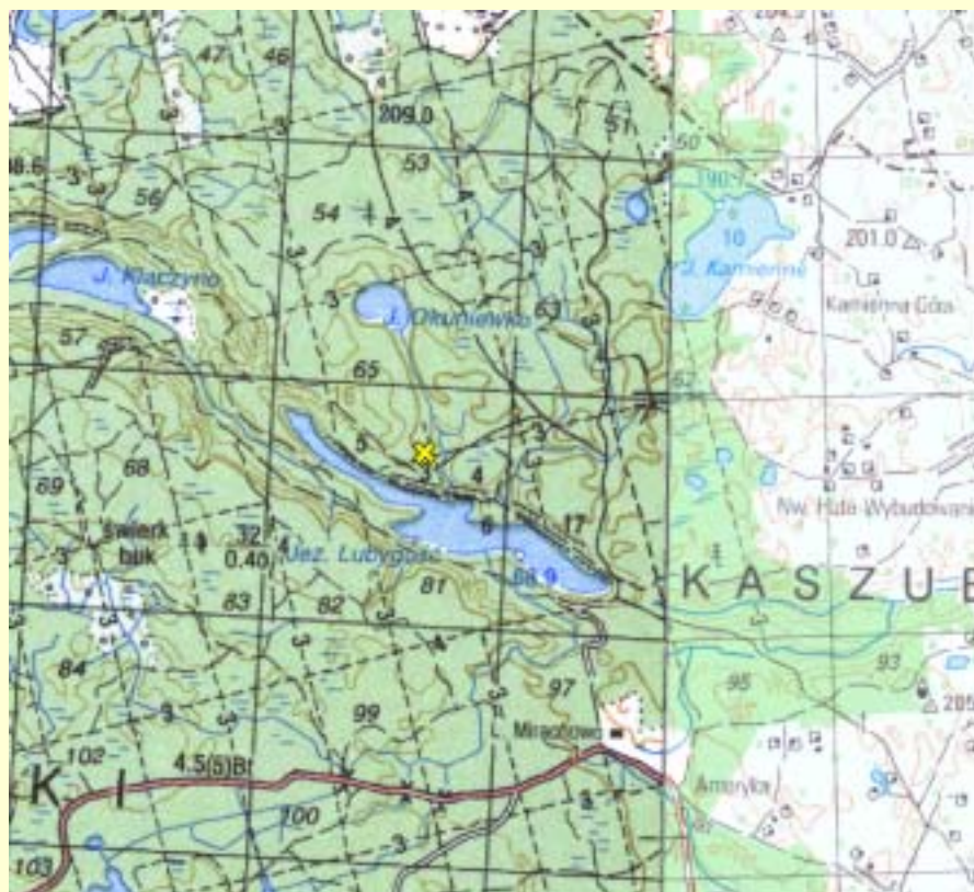
Mapa 2 Lokalizacja bunkra „Ptasia Wola” i pomnika upamiętniającego bohaterskich obrońców nad jeziorem Lubycze koło Mirachowa.