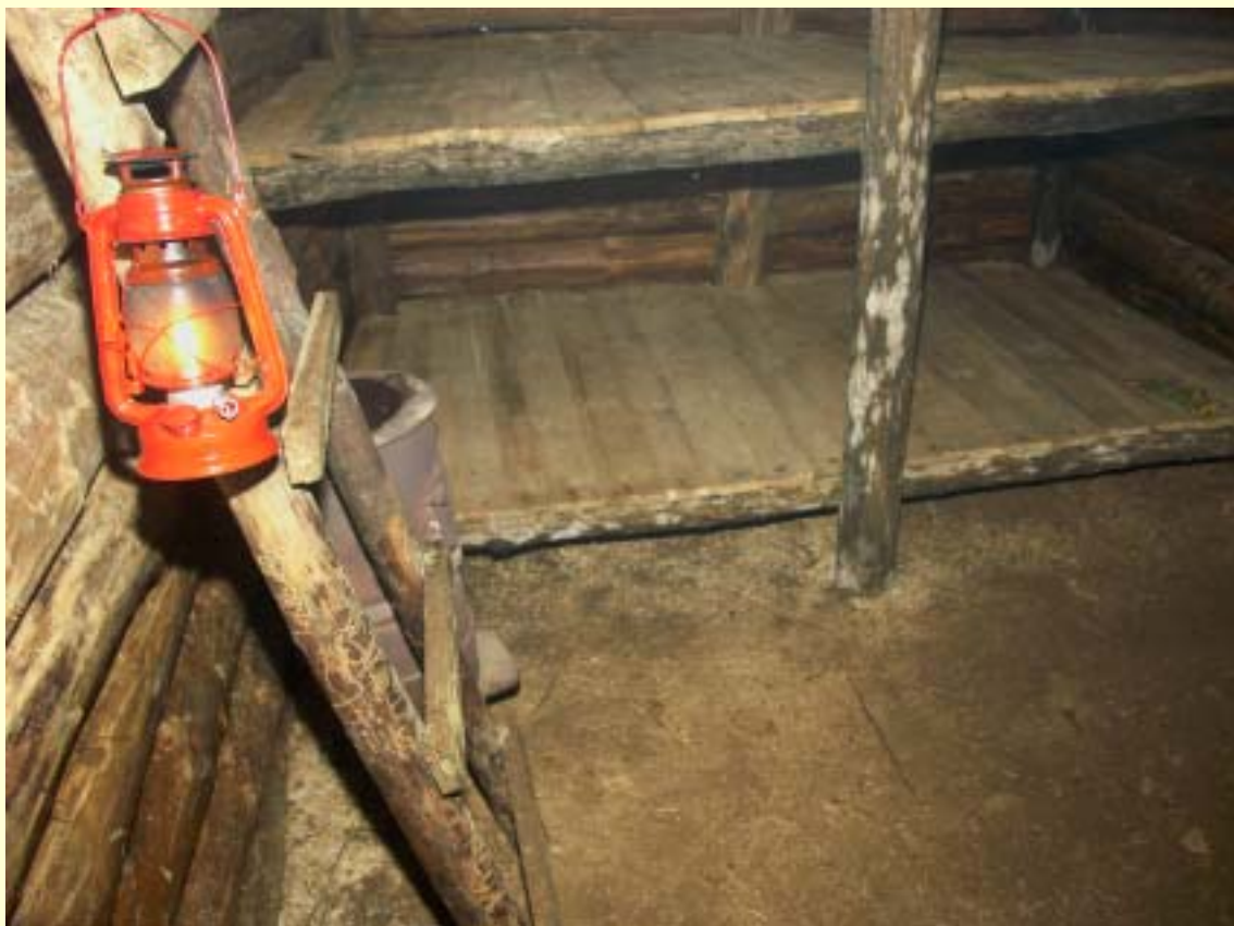
Fot. 7 Wnętrze bunkra po renowacji.