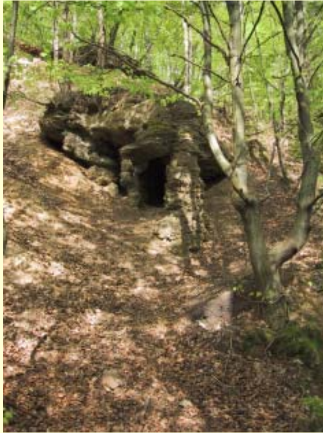
Fot. 4 Grota nieopodal bunkra stanowiąca naturalny punkt obserwacyjny dla trzymających wartę żołnierzy „Gryfa”.