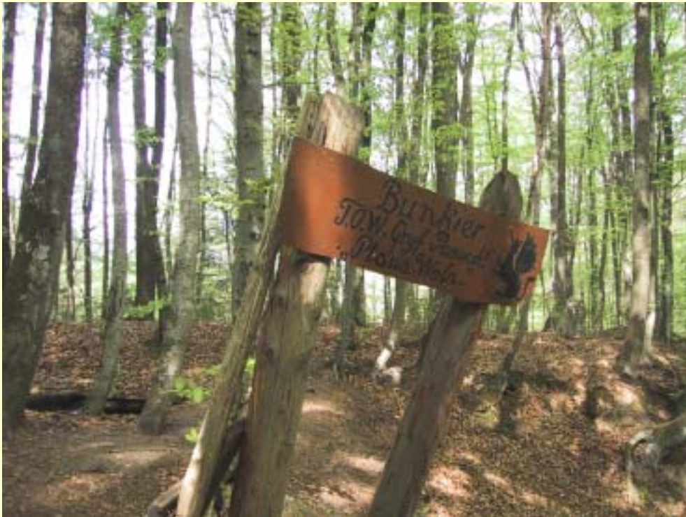
Fot. 2 Tablica informacyjna przed wejściem na teren gdzie znajduje się bunkier „Ptasia Wola”.