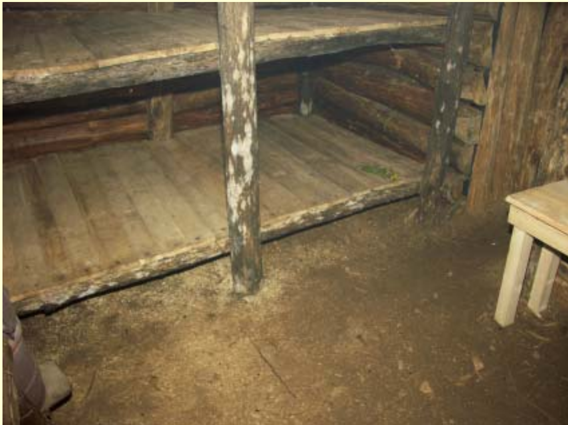
Fot. 8 Wnętrze bunkra po renowacji.