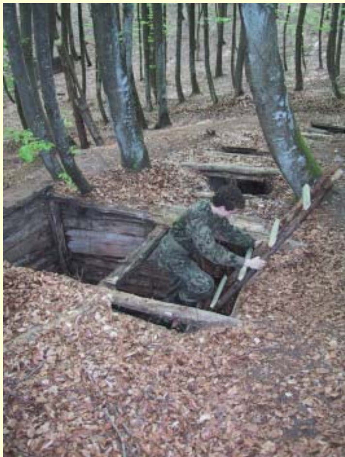
Fot. 3 Jedno z wejść do bunkra.