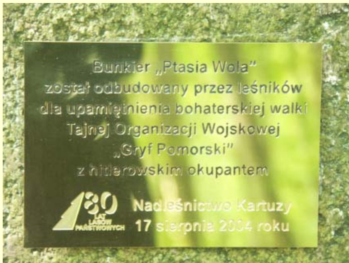
Fot. 15 Tablica informacyjna o wykonanej renowacji bunkra „Ptasia Wola” (widok tablicy w powiększeniu).