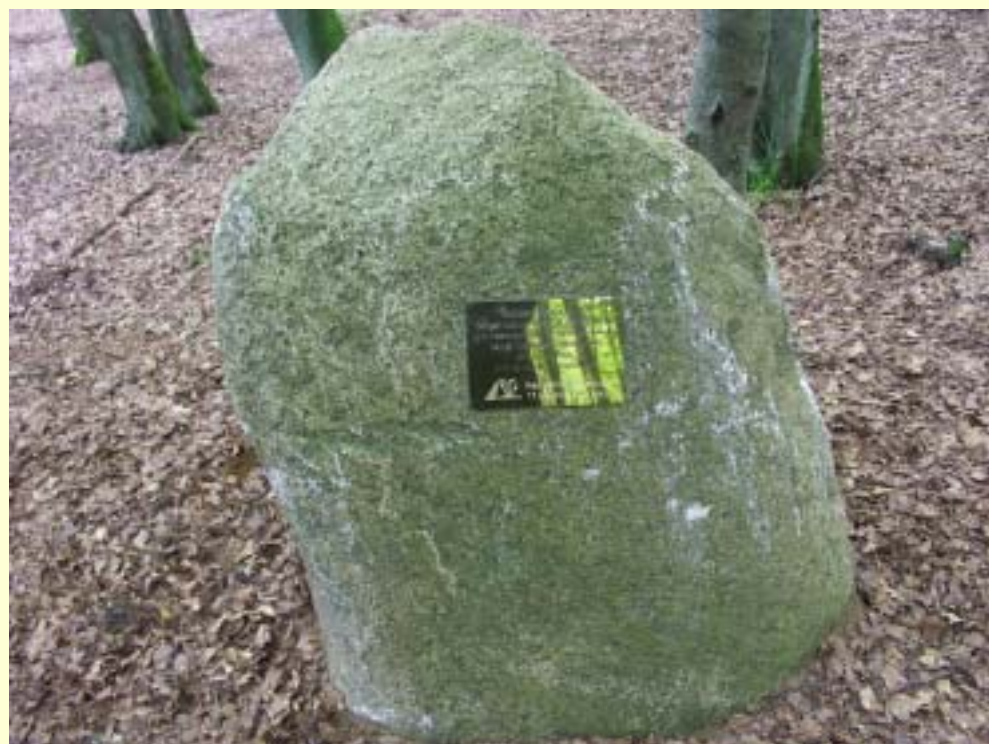
Fot. 14 Tablica informacyjna o wykonanej renowacji bunkra „Ptasia Wola”.