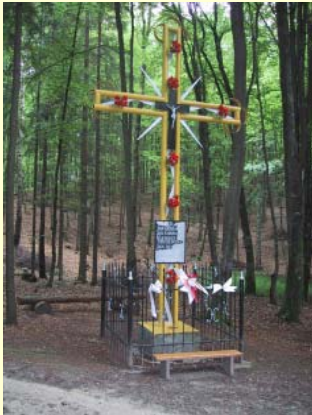
Fot. 12 Pomnik poświęcony bohaterom obrońcom bunkra.