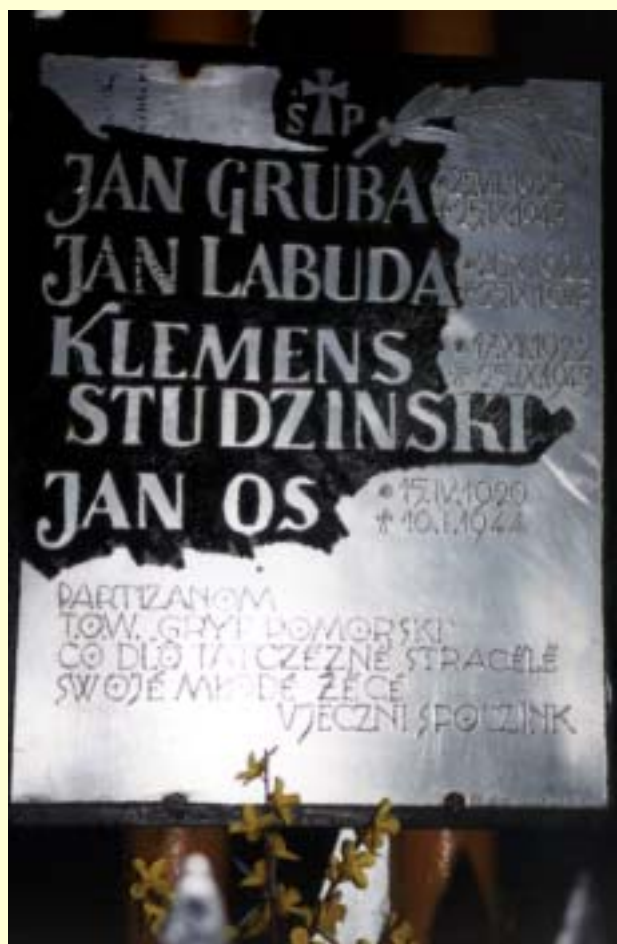
Fot. 13 Tablica upamiętniająca nazwiska bohaterów obrońców bunkra.