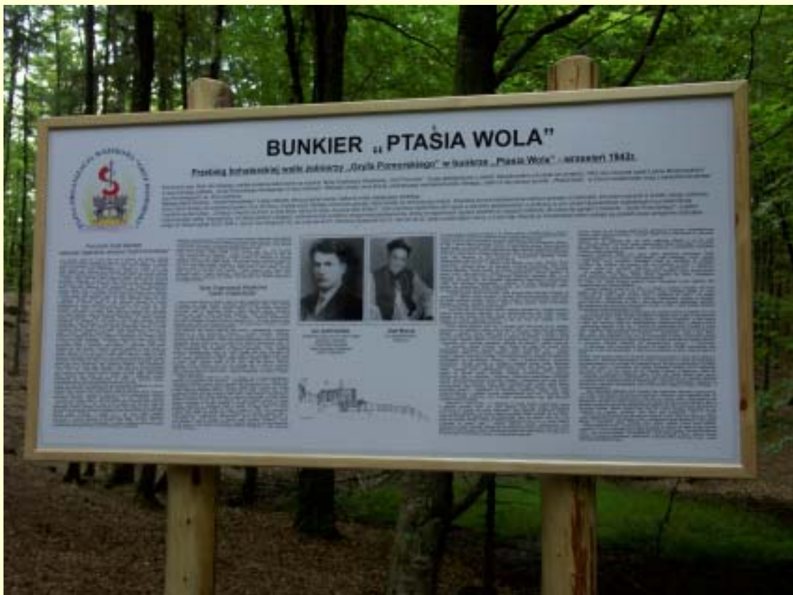
Fot. 9 Tablica informacyjna stojąca przed bunkrem (została tu umieszczona po jego renowacji w 2004 roku).