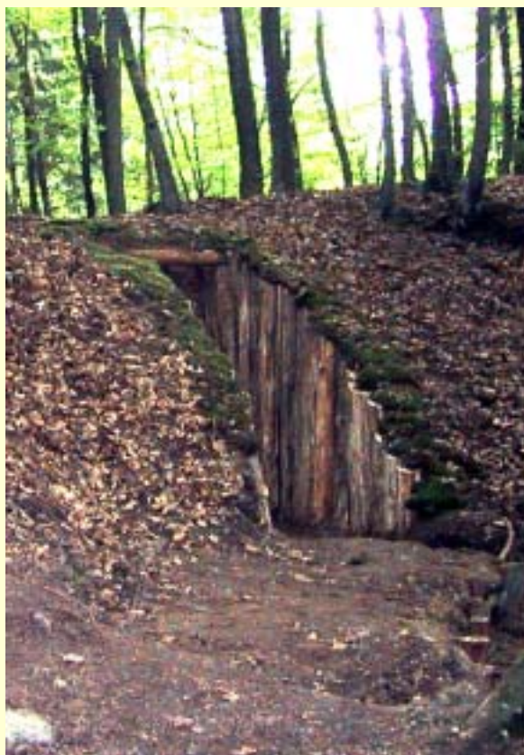
Fot. 11 Wejście do bunkra dla zwiedzających wybudowane podczas jego renowacji w 2004 roku.