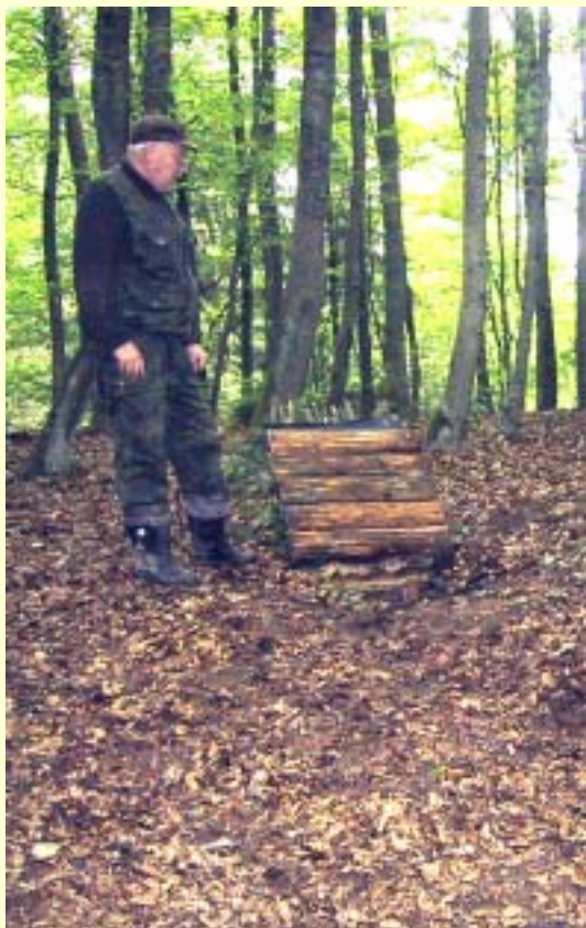
Fot. 10 Wejście do bunkra po jego renowacji w 2004 roku.