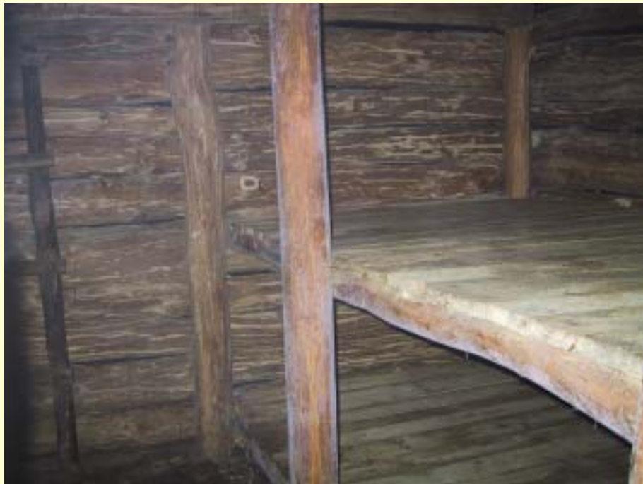
Fot. 5 Wnętrze bunkra po jego renowacji.