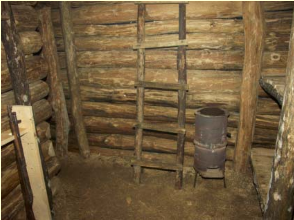
Fot. 6 Wnętrze bunkra po renowacji.