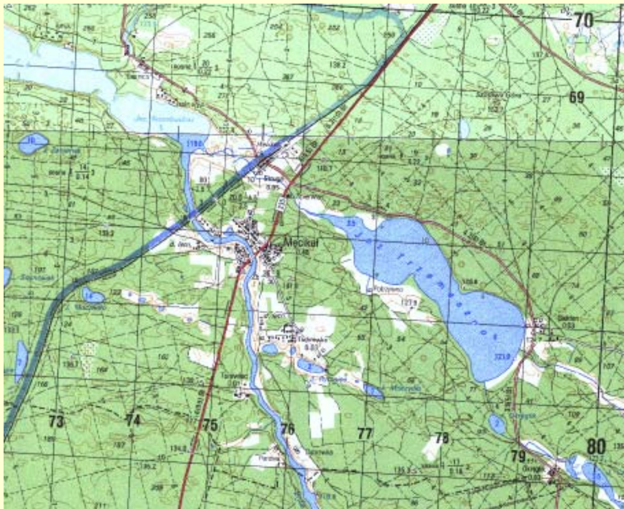
Mapa 1 Lokalizacja miejscowości Mięciak.