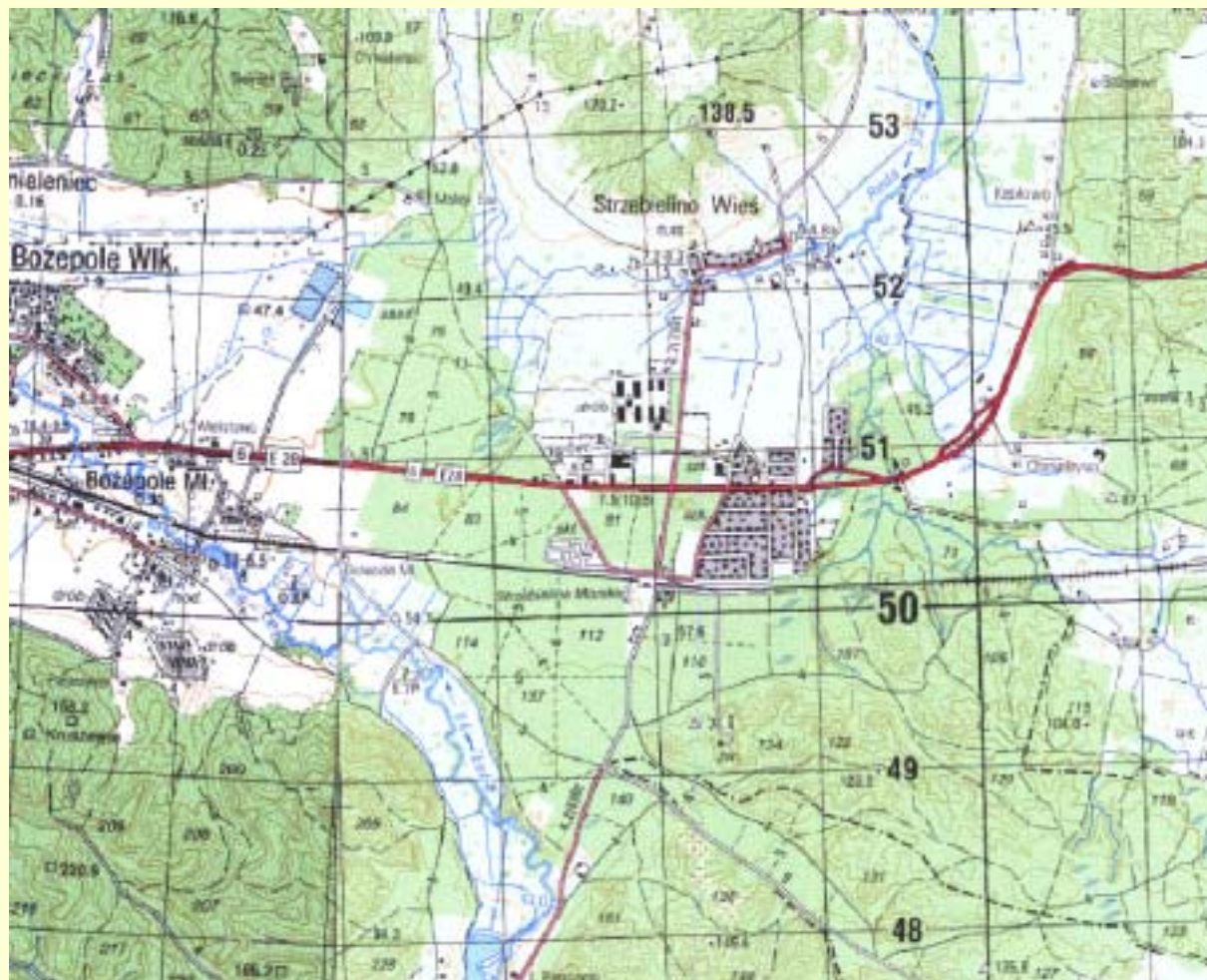
Mapa 1 Lokalizacja miejscowości Strzebielino.