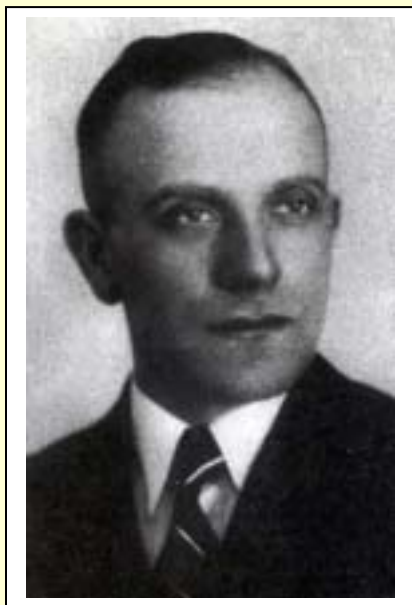
Fot. 1 Bolesław Formela

W dniu 24.09.1944 r. zmarł por. rez. Bolesław Formela ps. „Romiński”, były komendant naczelny TOW „Gryf Pomorski”, przed wojną poseł na sejm.