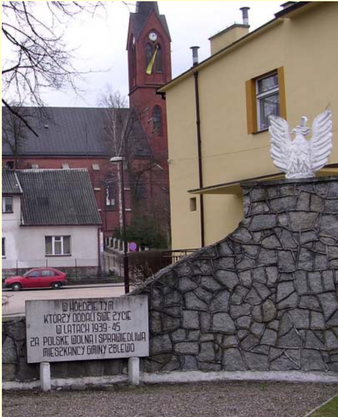
Fot. 4 W centrum Zblewa znajduje się pomnik poświęcony tym którzy oddali życie w walce z okupantem w latach 1939-45, w tym również partyzantom „Gryfa Pomorskiego”.