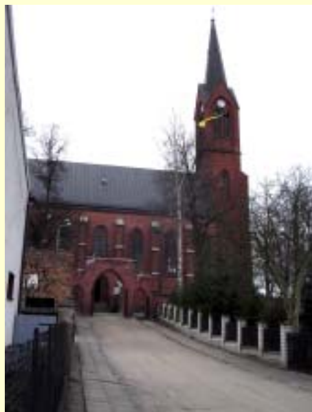
Fot. 2 Kościół w Zblewie na murach którego umieszczono pamiątkową tablicę poświęconą ks. Józefowi Wryczy.

W Zblewie w 1884 roku urodził się ks. Józef Wryczy. Mieszkańcy Zblewa upamiętnili to wydarzenie umieszczając na murach tutejszego kościoła pw. „św. Michała Archanioła” pamiątkową tablicę.