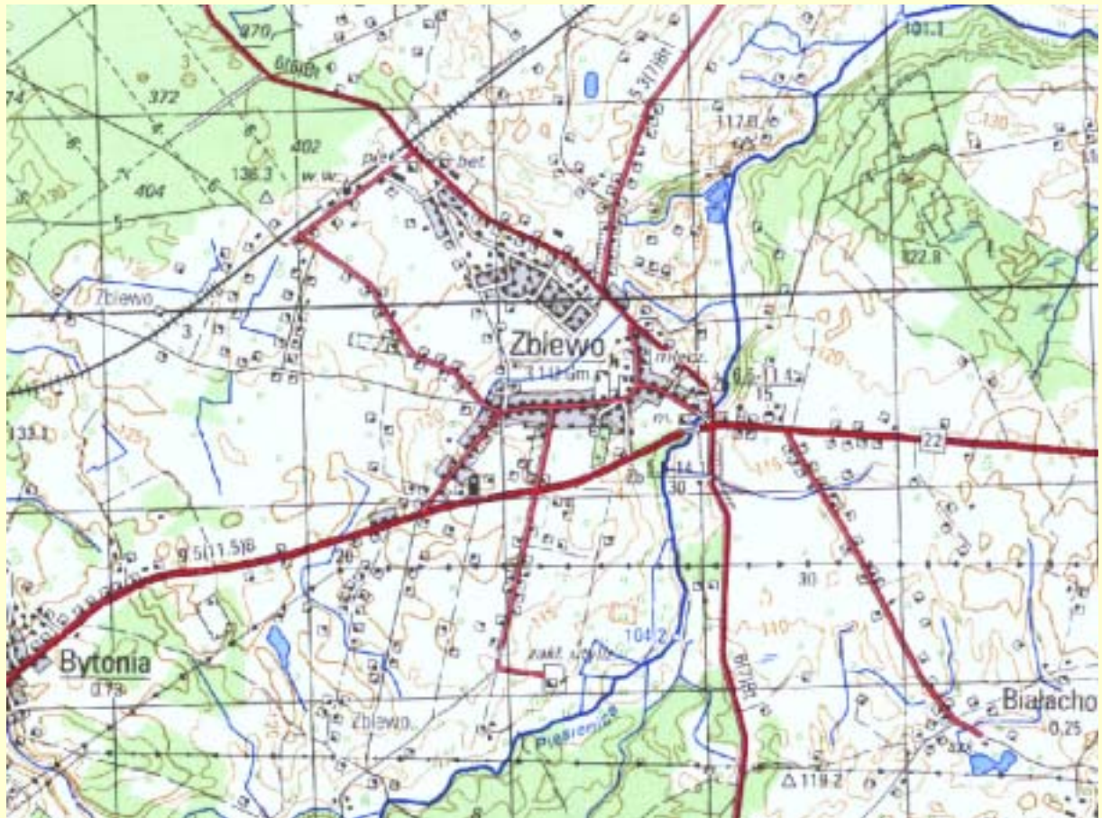
Mapa 1 Lokalizacja miejscowości Zblewo.