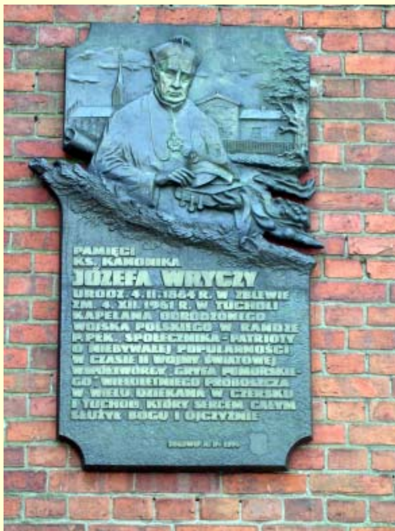
Fot. 3 Tablica pamiątkowa poświęcona ks. Józefowi Wryczy.